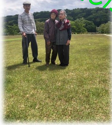
↑沼須町にある、沼田クライムスタジアム脇の広場です。テニスコートやウォーキングコースもあります。

4月の花の時期に続き、5月は新緑や暖かい日差しを楽しむことがで 6月は早々に関東地方の梅雨入りが発表され、雨の日は朝晩が寒いくらいですが晴れ間が見えた時にはちょこちょこ外に出たいと思います。