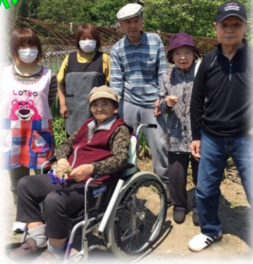
↑ホーム周辺の散歩コースですが、写真になると山に遊びに来たようです。